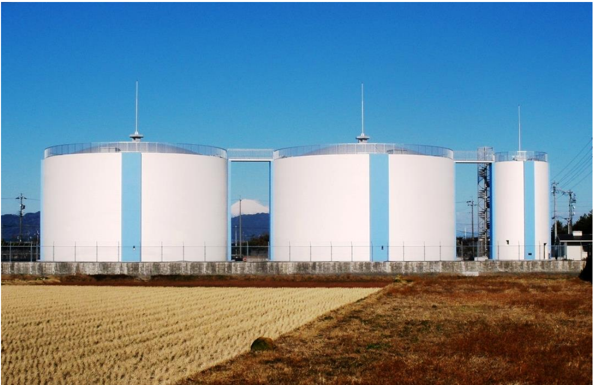
【上泉配水場配水池】